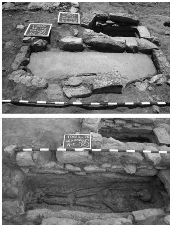
Figura 9. Una de les tombes intactes, amb la llosa monolítica de coberta sota el muret de senyalització i un cop oberta i excavada.