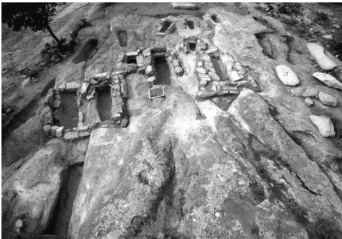
Figura 7. Vista general del conjunt de sepultures del sector II de la necròpolis del tossal de les Forques.