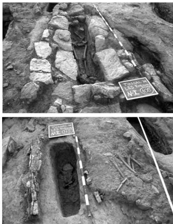
Figura 10. Superior: tomba amb un emmarcament tant peculiar que sembla gairebé una tomba de lloses. Inferior: tomba que conserva el muret a la banda sud i a fora restes d'un difunt extret de la sepultura.

cementiri parroquial de l'església medieval de Sant Martí de Lleida (Gallart et al. 1991, 122).