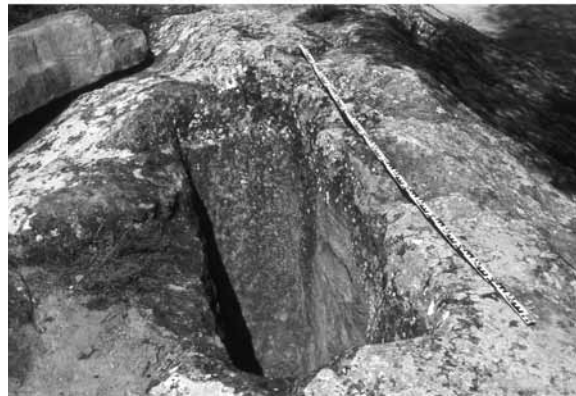
Figura 2. La impressionant fortificació del cap de pont de Balaguer realitzada per l'exèrcit franquista l'any 1938 i l'aprofitament d'una tomba de la necròpolis com a pou de tirador.