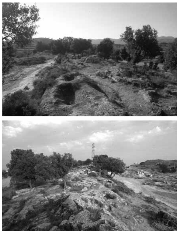
Figura 5. Dues imatges del sector I de la necròpolis del tossal de les Forques. Superior: el paleocanal cap a ponent. Inferior: el paleocanal cap a llevant; on s'està treballant correspon al sector II.

La necròpolis rupestre del tossal de les Forques està instal·lada sobre un paleocanal que mostra un desnivell de vuit metres entre l'extrem oriental, més alt, i l'occidental, més baix. Això fa que les sepultures a l'estar totes orientades canònicament a l'est, tinguin part del cap fins a 20 cm més baixa que la dels peus. La zona occidental del jaciment fou denominada sector I, que correspon a la primera part excavada i la que tenia més tombes a la vista, mentre que la banda més oriental, denominada sector II, fou