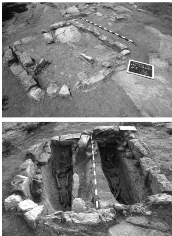
Figura 8. El conjunt de la parella del sector II abans i després de l'excavació. Cal destacar l'emmarcament de les dues sepultures.

Les tombes documentades al tossal de les Forques estan totes excavades a la roca, però hi ha la possibi-