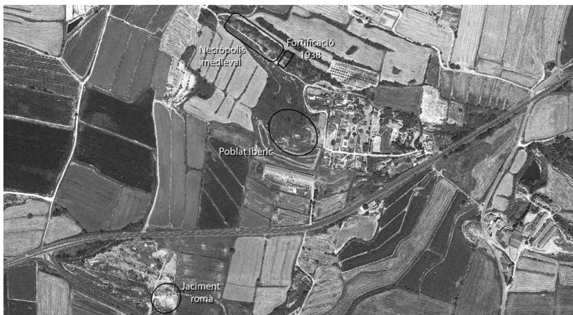
Figura 3. El conjunt arqueològic del tossal de les Forques.