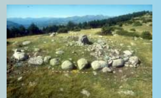
Panoràmica de la carena on es troba la necròpolis.