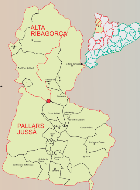
Situació del jaciment.

La necròpolis del Turó de la Capsera se situa a 1650 m. d'alçària, en una ampla carena de pendent molt suau, entre el turó de la Capsera pròpiament dit, que s'enlaira al nord-est, i un petit cim al sud-oest, que esdevé un bon lloc de pas natural entre el barranc de la Torre al sud, i el barranc de Sant Nicolau, al nord.