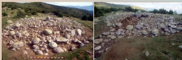
Procés d'excavació del túmul T-20.

Es localitzaren vint-i-set túmuls en prospecció, d'entre un i sis metres de diàmetre, a excepció del túmul T-20 d'onze metres. Els treballs se centraren en la neteja del túmul T-17 i en l'excavació parcial del T-20. A l'interior d'aquest es va localitzar un loculus en posició gairebé central, que contenia cendres, fragments ceràmics i restes òssies cremades pertanyents a un únic individu d'entre set i catorze anys.