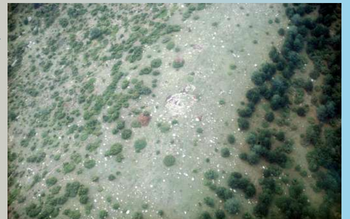
Vista aèria de la necròpolis del Turó de la Capsera. Al centre el túmul T-20.