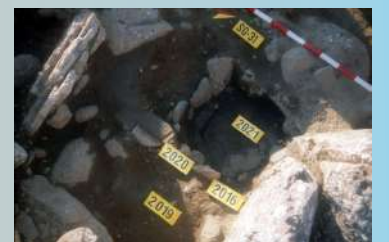
Vista del loculus del T-20.