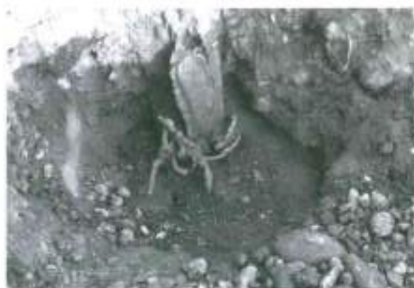
Fig. 5. Dalt: Imatge de la troballa del morrió i d'un fre. Baix: Imatge de la troballa d'un cap de cavall amb fre. Llegat Díez-Coronel.