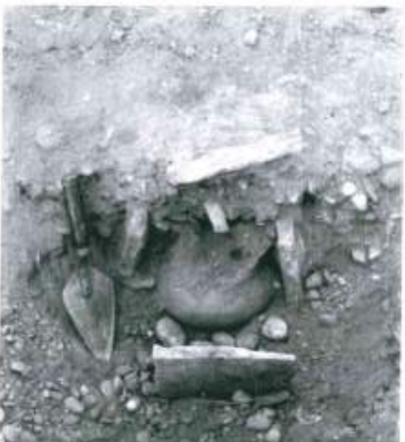
Fig. 6. Dalt: Documentació de la treballa d'una tomba complexa formada per quatre vasos. Baix: Localització d'un enterrament en cista.

localitzà en els talls restes de diversos enterraments. Malauradament, aquests ja havien estat destruïts i únicament va poder fer una breu descripció del que en quedava i realitzar un croquis a escala amb la ubicació d'aquestes restes, que, malgrat tot, ara ens possibiliten constatar l'existència d'una nova zona de necròpolis, així com la seva ubicació exacta.