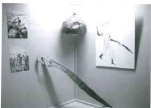
Fig. 3. Dalt: Fotografia dels objectes recuperats en els treballs previs a l'excavació, que ingressaren en el Museu Arqueològic de l'IEI amb data 8 de març de 1958. Baix: Fotografia de l'exposició de la falçata i el casc al Museu Arqueològic després de la remodelació de 1984.