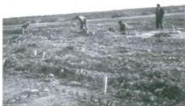
Fig. 4. Dues imatges corresponents als treballs d'excavació a la necròpolis de La Pedrera a la primavera de 1958.