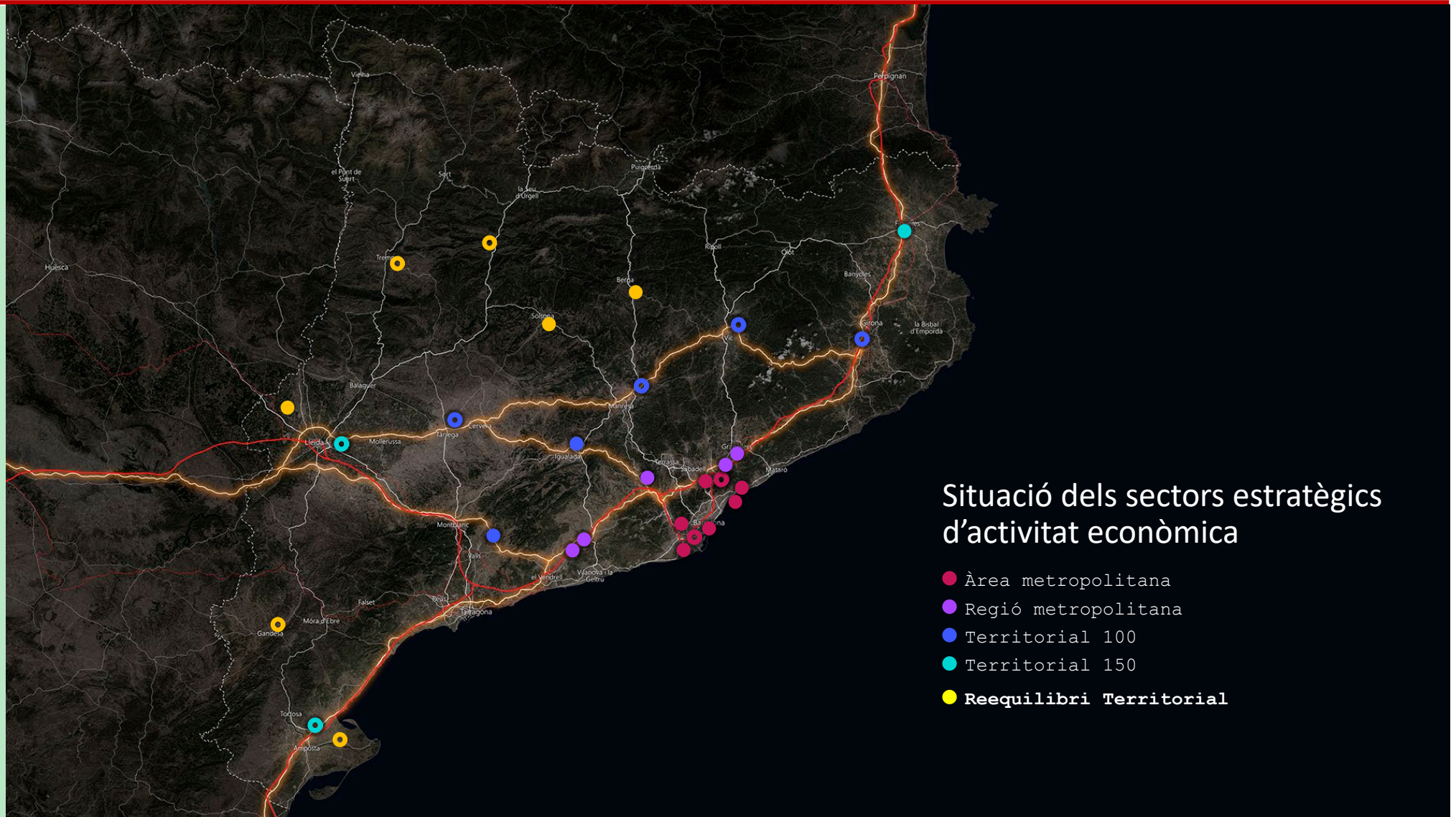
Situació dels sectors estratègics d'activitat econòmica